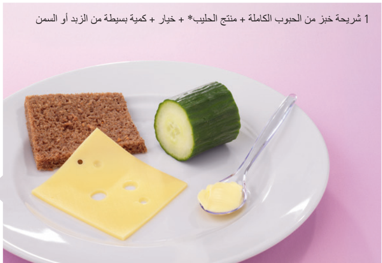
1 شريحة خبز من الحبوب الكاملة + منتج الحليب* + خيار + كمية بسيطة من الزبد أو السمن