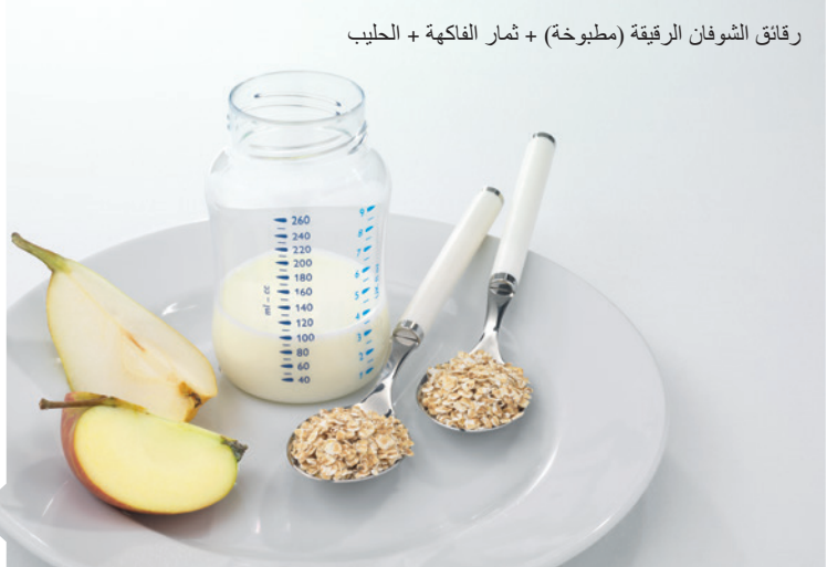
رقائق الشوفان الرقيقة (مطبوخة) + ثمار الفاكهة + الحليب