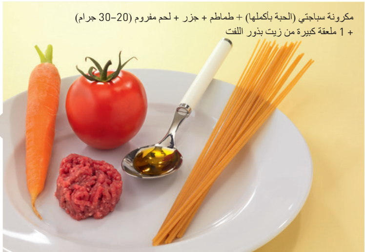
مكرونه سباجتي (الحبة بأكملها) + طماطم + جزر + لحم مفروم (20-30 جرام) + 1 ملعقة كبيرة من زيت بذور اللفت