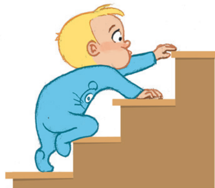
... ምምሃር ደረት ፃቕመይን ምውጋድ መጉዳክትን