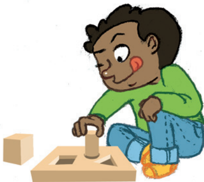
... ምስታፍ ኣብ ዘይኩሉፍ ጸወታ