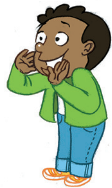
... ምግላጽ ገዛክ ርክሰይ