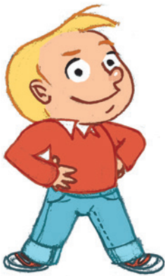
... ምህናጽ ርክሰ-ተካማንነተይ