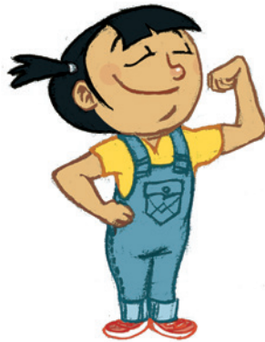
... ምምዕባል ጥንካረን ሜላን