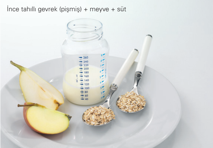
İnce tahıllı gevrek (pişmiş) + meyve + süt

Hayatın ilk yılının sonuna doğru bebek yemeğinden aile yemeğine geçiş yapılır.