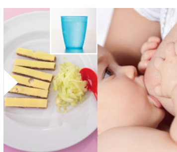
1 rebanada de pan integral + lácteo* + pepino + pequeña cantidad de mantequilla o margarina