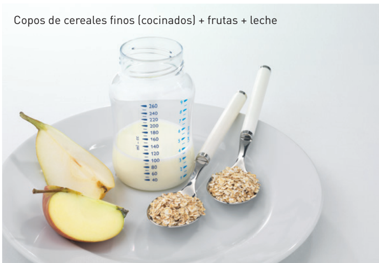
Copos de cereales finos (cocinados) + frutas + leche

Al final del primer año de vida se realiza la transición de comida para bebés a comidas de adultos.