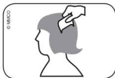
Abbildung 2: Durchkämmen des nassen Haares mit Läusekamm vom Haaransatz bis zu den Haarspitzen